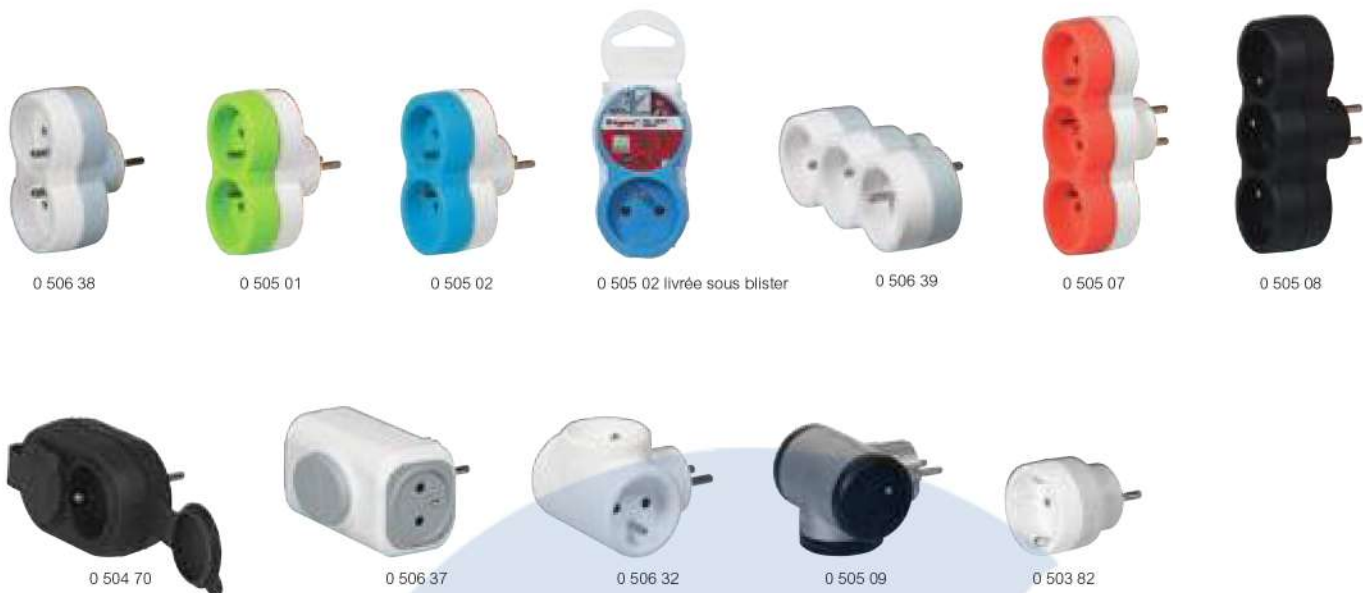
0 506 38 0 505 01 0 505 02 0 505 02 livrée sous blister 0 506 39 0 505 07 0 505 08